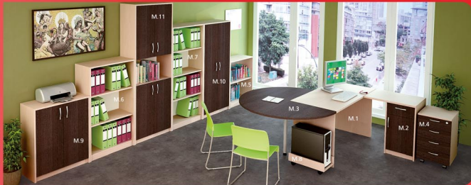
Бюро Авангарг M.1